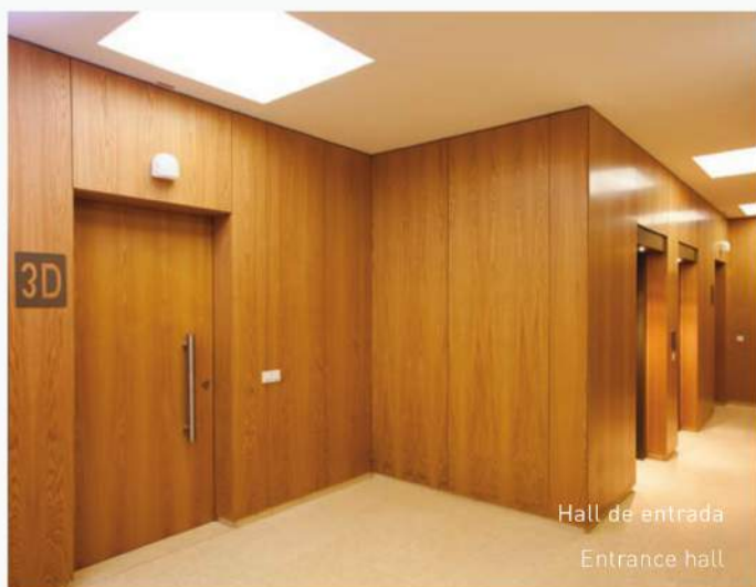
Hall de entrada Entrance hall

Integrated in a project with Teixeira Duarte's seal and warranty, each building consists of around 3.540m 2 dedicated offices' space, distributed over 7 floors, offering flexible areas and leading technical solutions complemented by the convenience granted by the parking spaces in the basement.