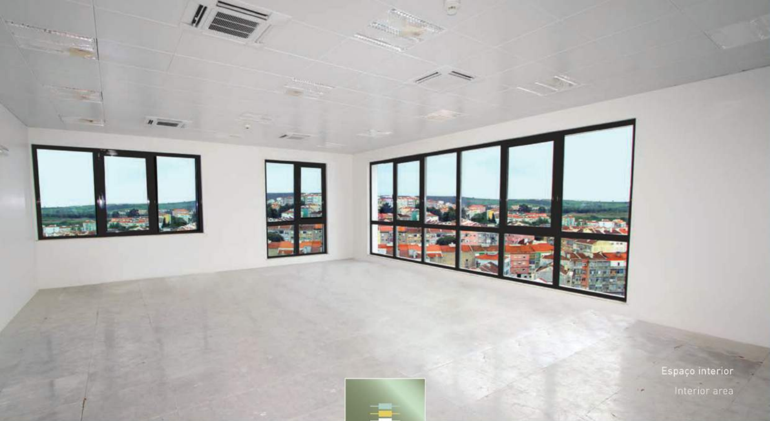
Espaço interior Interior area