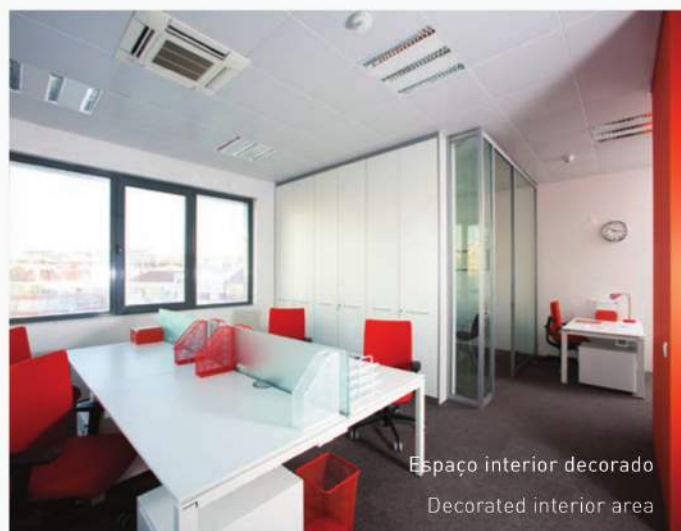
Espaço interior decorado Decorated interior area